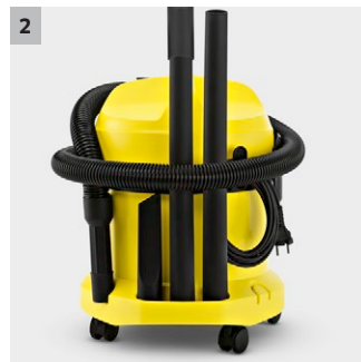
2 Praktikus kábel- és tartozéktárolás