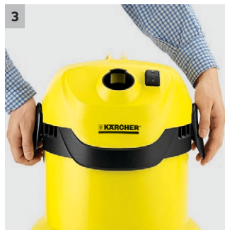
3 „Pull & Push“ zárrendszer