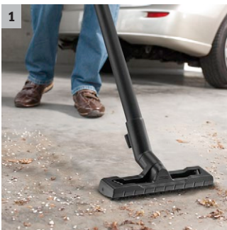
1 Új fejlesztésű padlófej